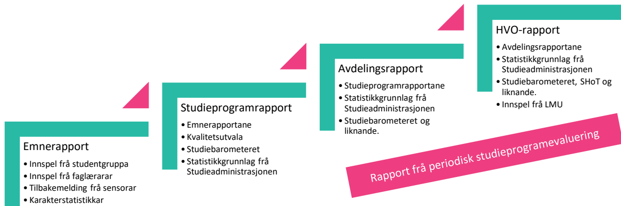
Figur 3: Hovudstammen i kvalitetssystemet